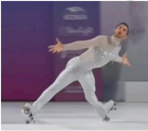
Spread Eagle (Heel): min. 120° entre as pernas